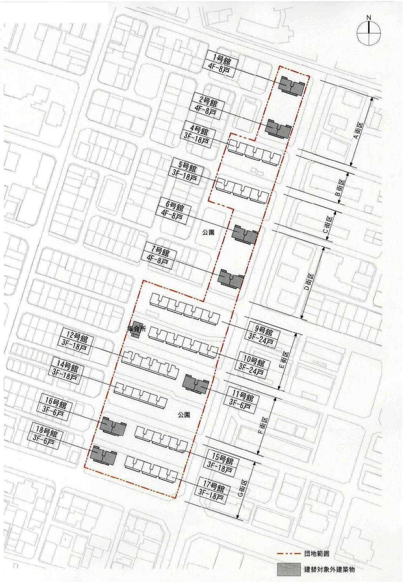
別紙（建替前配置図）