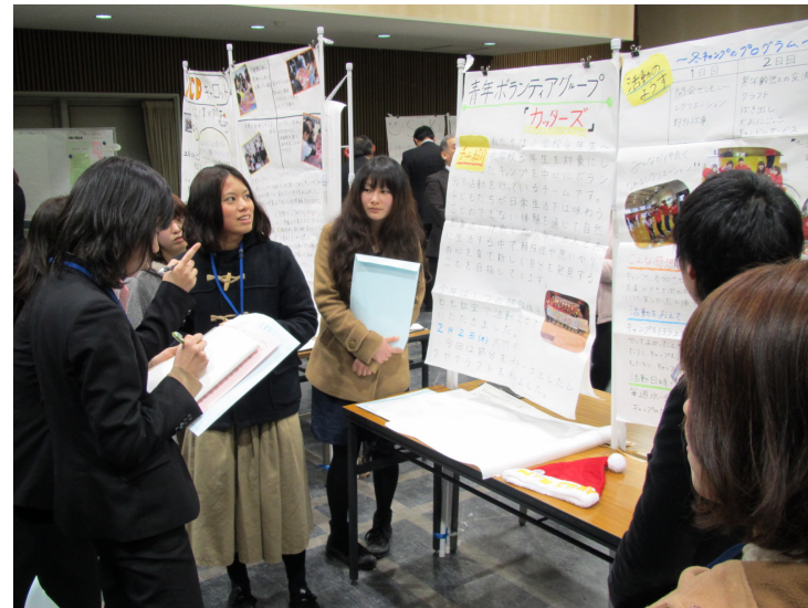
平成23年度「ワクワク学び隊」実践交流会の様子