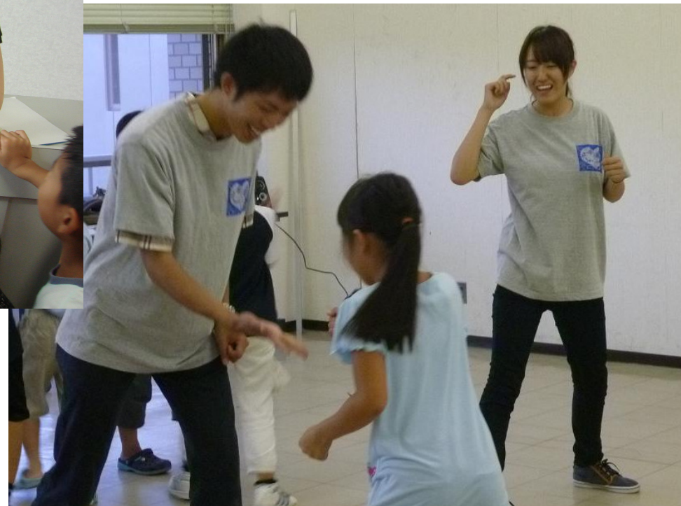
～レクリエーションの活動～