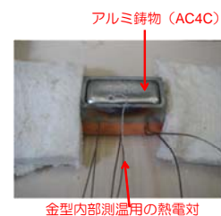
鉄鋼-銅ハイブリッド金型を使った casting の様子