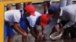
6月24日 クワイの植え付け