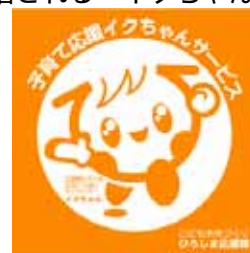
ステッカーイメージ

Kids 情報送信サービスとは、(財)ひろしまこども夢財団が実施している会員制のサービスで、12歳以下の子どもの保護者等を対象に、携帯電話のメール機能を活用して子育てに役立つ情報を送信するもの(無料)