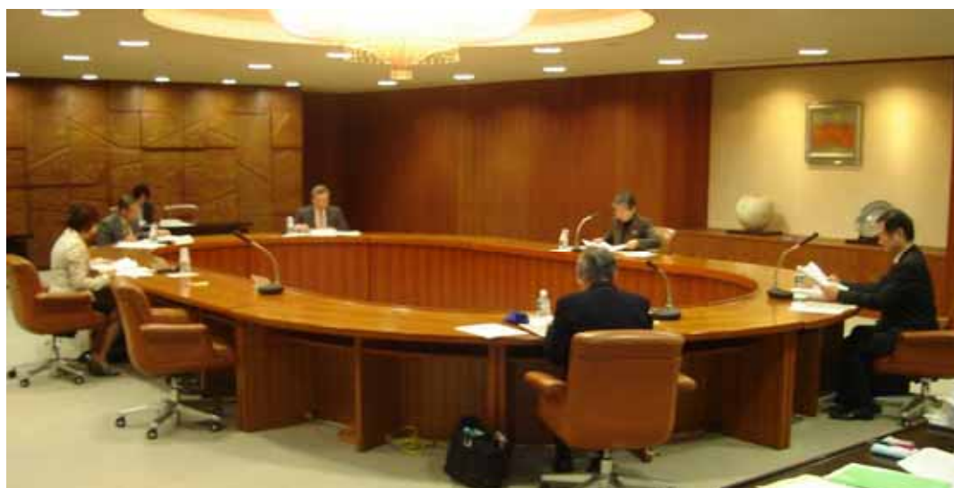
広島県男女共同参画審議会（平成19（2007）年3月23日）の会場写真