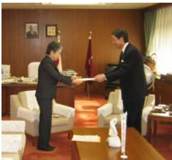
広島県男女共同参画審議会会長から知事への答申 （平成17（2005）年12月26日）