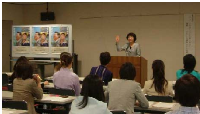
働く女性のポジティブ・アクション推進セミナー(平成17(2005)年7月22日) 福山会場の写真