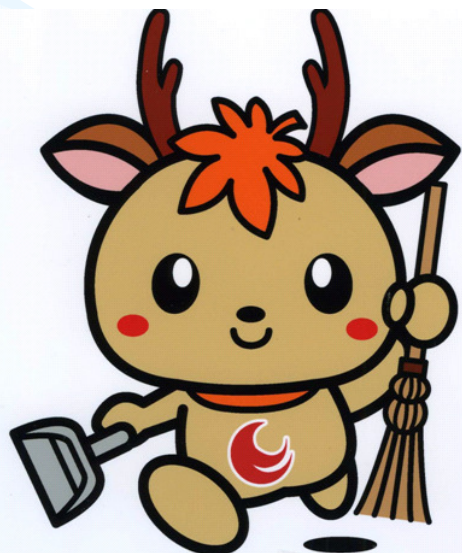
広島県アダプト制度マスコット キャラクター「アダピィ」