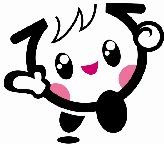
広島県の子ども元気いっぱい キャラクター「イクちゃん」