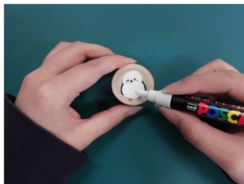
④ マジックや色鉛筆で着色する。