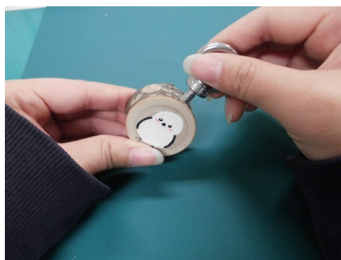
⑤ アイボルトを取り付ける。