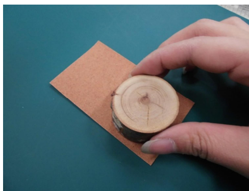
② 紙やすりで表面を磨く。