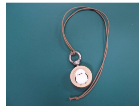
⑥ 首掛けひもを取り付けて完成。