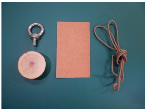
① バードコールで使うものを用意する。