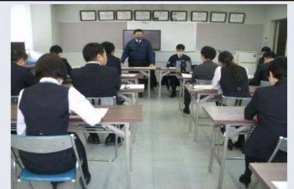
銀行での出張講習