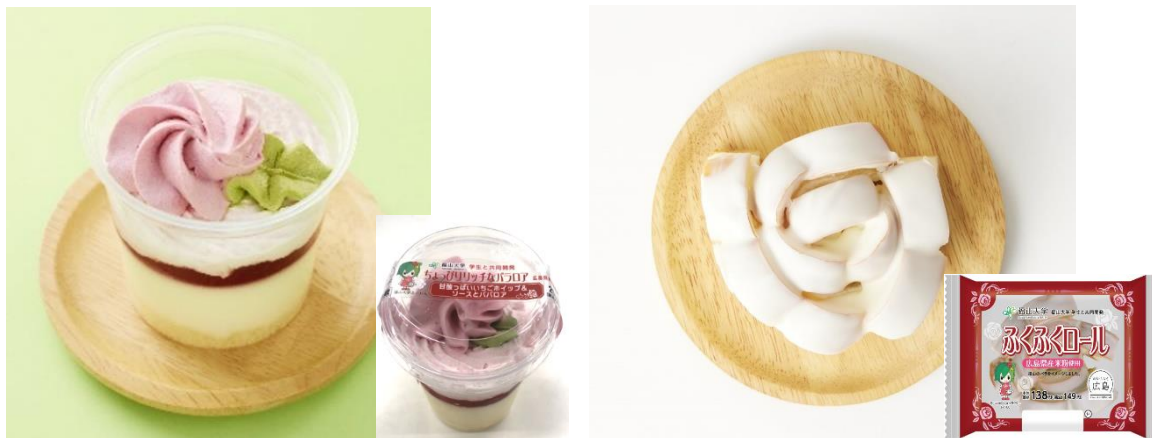
「ちよっぴりリッチなバラロア(広島県産米粉使用)」(税込278円) 「ふくふくロール(広島県産米粉使用)」(税込149円) ※画像はイメージです。

株式会社ローソン(本社:東京都品川区、代表取締役 社長:竹増 貞信)は、2024年3月26日(火)から、中国・四国地区のローソン店舗(約1,500店:2024年2月末時点)で、学校法人福山大学(所在地:広島県福山市)の学生さんが考案した、広島県産米粉を使用したデザート「ちよっぴりリッチなバラロア(広島県産米粉使用)」(税込278円)とベーカリー「ふくふくロール(広島県産米粉使用)」(税込149円)を発売いたします。