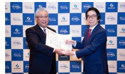
パートナーシップ構築シンポジウムでの表彰

コンシューマープロダクツ事業製品、ケミカル事業製品の製造、販売、これらに付帯するサービス業務等