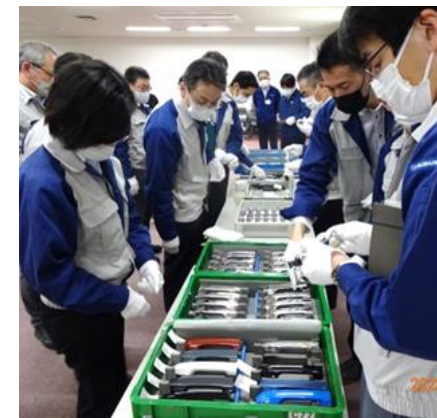
部門横断的チームによる対応の様子