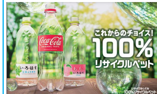
リサイクルPETボトルの取り組み推進