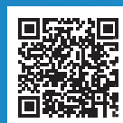
広島市中小企業支援センター ホームページ

〒733-0834 広島市西区草津新町一丁目21番35号(広島ミクシス・ビル2階) TEL 082-278-8032 FAX 082-278-8570 E-mail: assist@ipc.city.hiroshima.jp URL: https://www.assist.ipc.city.hiroshima.jp/