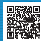
広島市工業技術センター ホームページ

〒730-0052 広島市中区千田町三丁目8番24号(広島市工業技術センター内) TEL 082-242-4170 FAX 082-245-7199 E-mail: kougi@itc.city.hiroshima.jp URL: https://www.itc.city.hiroshima.jp/