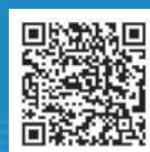
【公式】いい店ひろしま Instagram