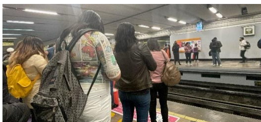
通学で使うメトロの朝の風景