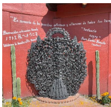
Árbol de la vida 生命の樹

今回「死者の日」の当日、私は世界一大きな？ Ofrenda (祭壇) があるとされる Metepec (メテペック) という街に行きました。Metepec はメキシコシティから車で約1時間西に行ったところにある場所で、伝統工芸品 Árbol de la vida (生命の樹) で有名な場所でもあります。Árbol de la vida とは木の形をした焼き物で、まるで軒の実がなるように人や動物など様々な装飾でつくられた工芸品になります。サイズも数センチのお土産サイズから数メートルに及ぶ大きなものまで多種多様です。