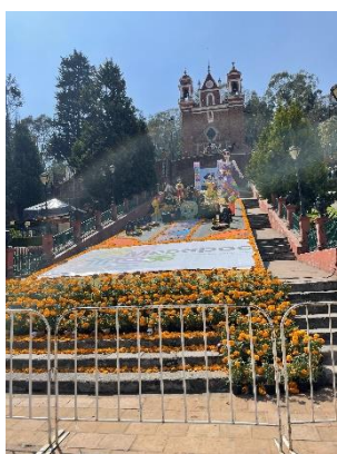
世界 1 大きな ofrenda

そんな工芸品の街 Metepec の中心部にある教会の階段にはひととき目立つ大きな ofrenda がありました。この ofrenda 毎年テーマが異なるようで、今年は楽器を持った骸骨が飾られていました。日暮れが近づくと街の人たちも出歩くようになりお祭り騒ぎでとても楽しかったです。骸骨貴婦人 カトリーナメイクもしてもらいました！このカトリーナ、今ではメキシコ国内でも人気の死者の日のアイコンですが、もとは José Guadalupe Posada が描いた「La Calavera Garbancera (住み込み女性のガイコツ)」という先住民の文化が失われていくことへの風刺画がもとになったそうです。