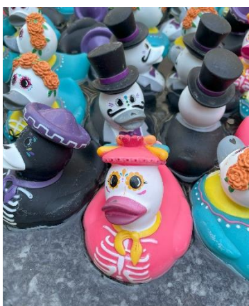
10 月のお気に入り写真