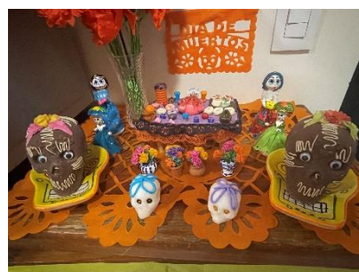
住んでいる家に飾った ofrenda→

今回「死者の日」の当日、私は世界一大きな？ Ofrenda (祭壇) があるとされる Metepec (メテペック) という街に行きました。Metepec はメキシコシティから車で約1時間西に行ったところにある場所で、伝統工芸品 Árbol de la vida (生命の樹) で有名な場所でもあります。Árbol de la vida とは木の形をした焼き物で、まるで軒の実がなるように人や動物など様々な装飾でつくられた工芸品になります。サイズも数センチのお土産サイズから数メートルに及ぶ大きなものまで多種多様です。