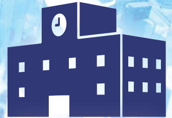
呉高等技術専門学校

在職者訓練の実施 講師（指導員）の派遣・技術相談 事業主推薦による訓練生の受け入れ （第2期選考で定員未充足の1年課程のみ）