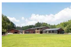
white fox ふれあいパーク ホワイトフォックス