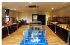
アイデオー譲渡子犬展示室