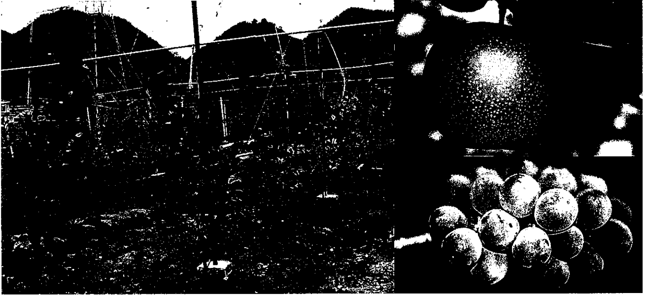
柑橘「はるみ」の改植園