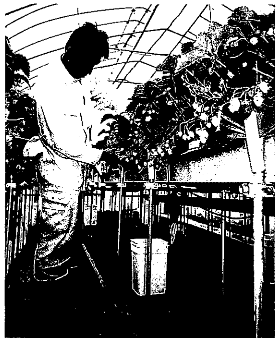
腰を曲げずに収穫作業

この技術が完成すれば、10a当たり140万円程度の投資で本圃での栽培管理、収穫作業が格段に楽になり、しかも、土耕栽培と同等以上の収量、品質を得ることができます。