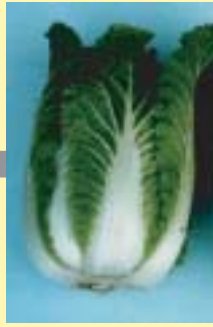
根こぶ病 抵抗性近縁種