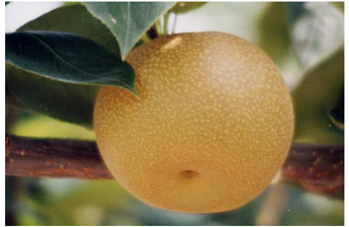
ナシ「愛甘水」の果実

ナシ「愛甘水」の大玉・高糖 度果実生産は、短果枝中心 に結実させ、着果番果は 2～ 5 番果を使います。