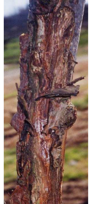
ナシ樹の主幹部に発生した胴枯性病害