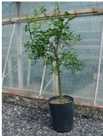
本日使用のカラタチ台木