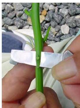
芽の下から 1cm から薄く剥く