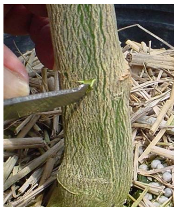
次に縦にいれ T の字に切れ目を入れて観音開きにする。