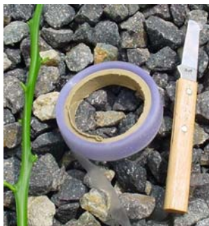
穂木・接木テープ・芽接ぎ刀