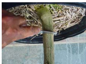
まず横に切り込みを