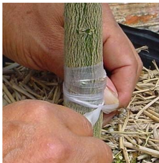
接木テープでしっかり縛って完成！