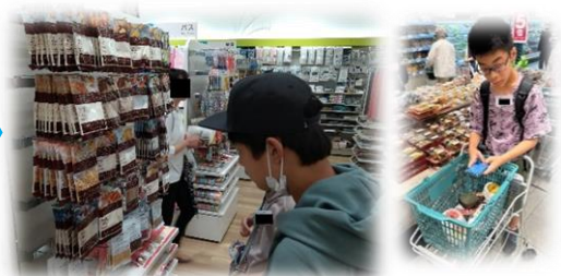
もっと少ない量の商品はないかな??