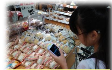
予算500円で買えるかな