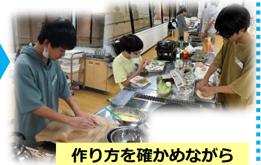
作り方を確かめながらクッキング開始