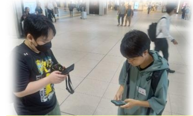
地図を使って、お店の場所や経路を調べてみる