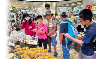
お店に行き、材料費(2,000円程度)を計算