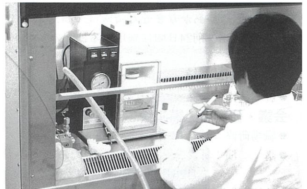
パーティクルガンによる植物細胞への遺伝子導入

遺伝子導入には、パーティクルガン法を用いました。この方法は、遺伝子を付着させた金属微粒子を細胞内に打ち込み遺伝子を導入する手法です。この手法を利用し、細胞が青色に染まる指標遺伝子をアスパラガスの培養細胞に導入を試みたところ、効率よく導入することができました。この手法は、他の作物に対する遺伝子導入にも利用できます。