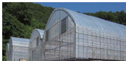
図1 県内のレモン栽培ハウス(瀬戸田町)

そこで、令和5年度からは、これまで得られた研究成果を多くの現地指導者や生産者に活用していただける「ハウスレモンの開花期予測支援ツール」の開発に取り組んでいます。