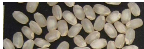
図1 「広系酒 45 号」の玄米

本年は安芸高田市高宮町、三次市三和町、東広島市高屋町の3地域で各2ha栽培されており、秋には約30tのお米が収穫できる予定です。県内の酒造会社がこのお米を使って試験醸造し、お酒は一般に販売される予定です。是非ご賞味ください。