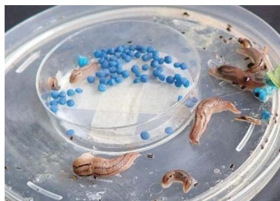
図 トラップにかかったチャコウラナメクジ