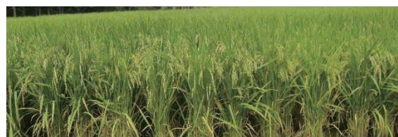
図2 現地栽培の「広系酒 45 号」(R4 年)

玄米の中心部が白く濁っている部分を心白といいます。飯米品種ではほとんど発生しません。心白があることで、米の中に麹菌が均等に入り込むことができます。