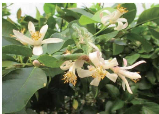
図2 ハウスレモンの開花(令和4年12月)