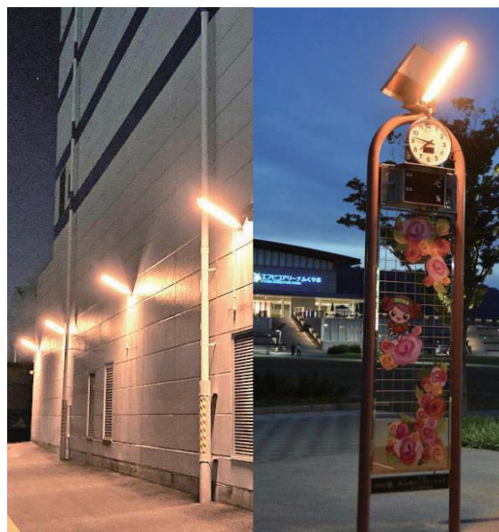
図 LED ランプ「美観灯」の導入事例 左)オタフクソース株式会社本社工場(広島市) 右)エフピコアリーナふくやま(福山市)

福山市にあるモニュメントを美しく照らしているのも「美観灯」です(右図)。周囲の景観に見事に溶け込み、訪れる人々を静かに、そして優しく見守っているかのようです。