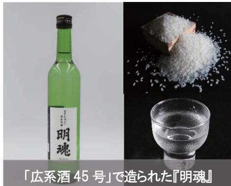
「広系酒 45 号」で造られた『明魂』