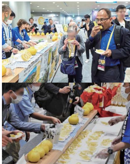
図 「瑞季」を試食する海外メディア等

サミット最終日の5月21日の朝、国際メディアセンターのプレゼンブースで、試食準備のため果実をカットしていると、通りかかる各国のメディア関係者は「いい香り」といって足を止め、「何時から食べられるの？」と興味津々。11時の開始とともに、多くの国内外の方々が集まり、食べやすくカットした「瑞季」を次々に試食され、「黄色いから酸っぱいイメージだったけどとても甘い」、「ブタンって海外ではグレープフルーツぐらいしかないからとても珍しい」および「果皮も食べられるなんて健康的で良い」などの好評をいただきました。