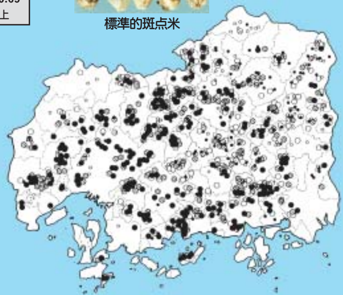
標準的斑点米の発生分布(1982~1998年)