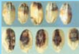
カスミカメムシ斑点米