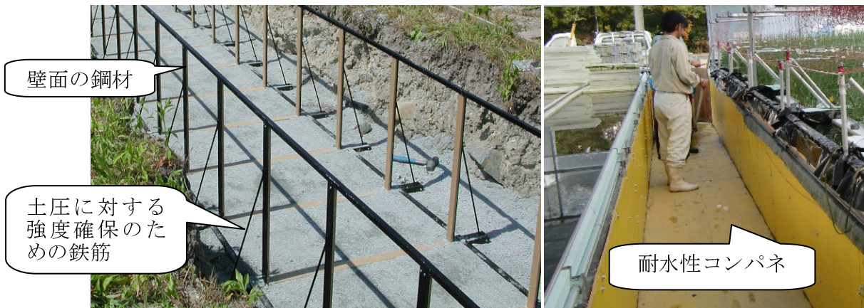
図3 施工中（左）と施工完了後（右）の作業ピット