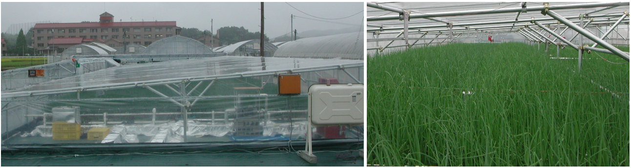
図1 棟高1.8mの片屋根型低棟ハウス（左）と施設内全面でネギの栽培（右）