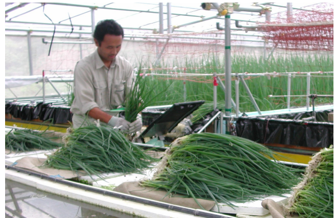
図5 水路を用いて収穫物を運搬