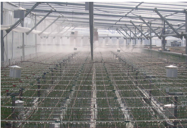
図4 移動式ブームノズルでの病害虫防除