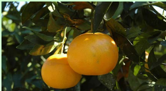
図1 「広島果研11号」の結実状況