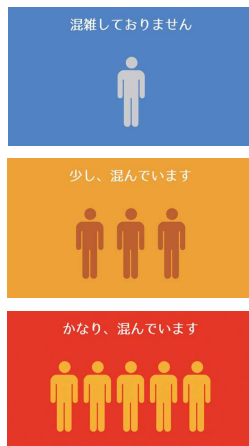
▲混雑状況の表示イメージ