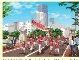
地域特性を生かしたにぎわいづくり