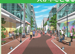
歩いて楽しい人中心のまち