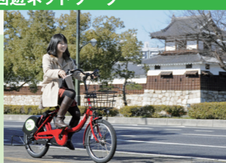
誰もが快適にめぐることができるまち