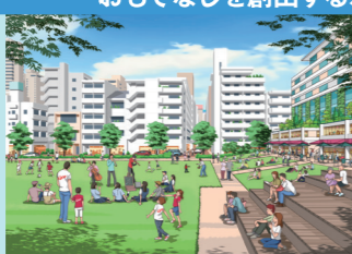
リビングのような公園