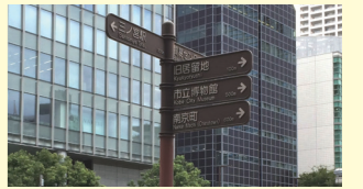
わかりやすい案内・サイン