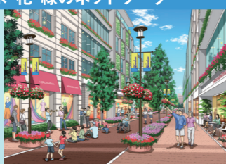
花と緑と音楽のあふれるまち