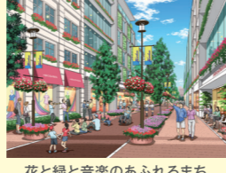
花と緑と音楽のあふれるまち