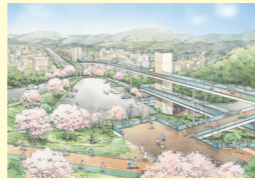
比治山公園「平和の丘」構想の推進