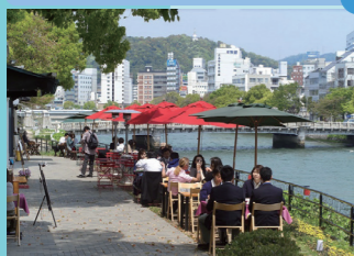
水と緑にふれることができるまち