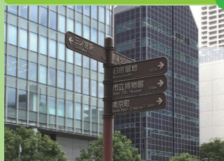
誰もがスムーズに回遊できるまち