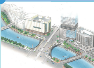
水の都ひろしまにふさわしい水辺