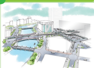
誰もが利用しやすい交通拠点