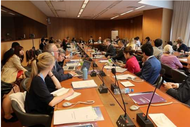
【写真1】 国際会議やワークショップに参加する様子 (イメージ)

広島県/HOPe が今後実施・参加する様々な活動に国内・国外で従事していただきます。