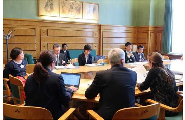
【写真2】 国内外でミーティングに同行する様子 (イメージ)