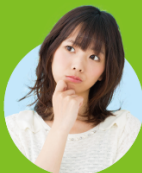
サイト訪問者の本音…