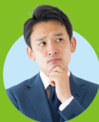
サイト訪問者の本音…