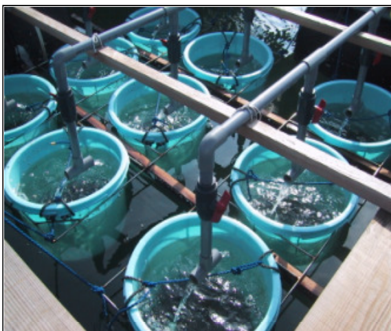
ダウンウエリング法による一粒かきの飼育装置例