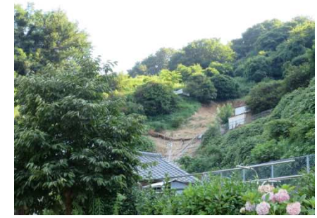
斜面崩壊・被災状況（平成30年7月）