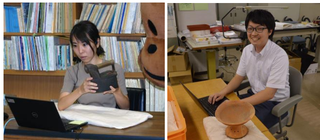
※撮影のためマスクを外しています。

歴史や博物館に関すること、学芸員に関すること、何でも質問してください。私たちがお答えします。