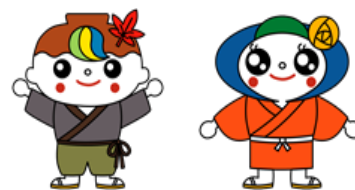
歴史博物館マスコットキャラクターの「くさどっきー」（左）と「せんちゃん」（右）です。