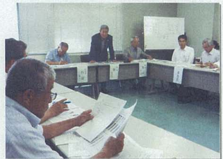
上：開会のあいさつをする叡会長