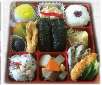
全国栄養教諭・学校栄養職員研究大会で提供した「ひろしま給食弁当」