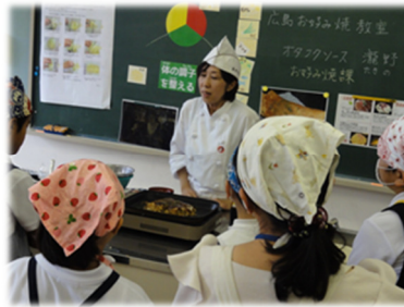
「出前講座」 （庄原市立高小学校）