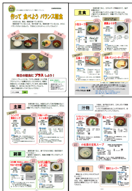
「朝食リーフレット」

また、今年度は栄養バランスのとれた朝食の摂取を促すために、『作って！食べて！健康に』をコンセプトとして、応募のあったレシピの中から、栄養教諭が中心となって、日々の朝食に取り入るとよいメニューを組み合わせ、栄養バランスのとれた「朝食リーフレット」を新たに作成し、ホームページ等で発信した。