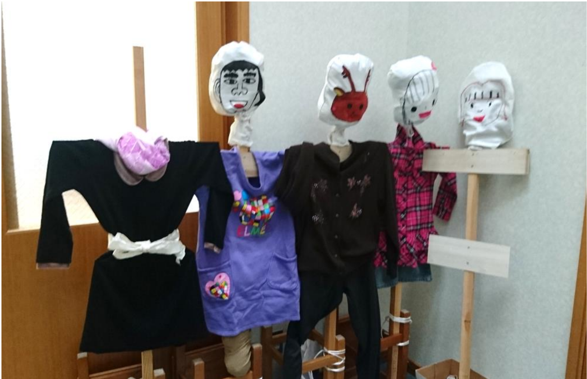
「かかしびら」(栗生学区)