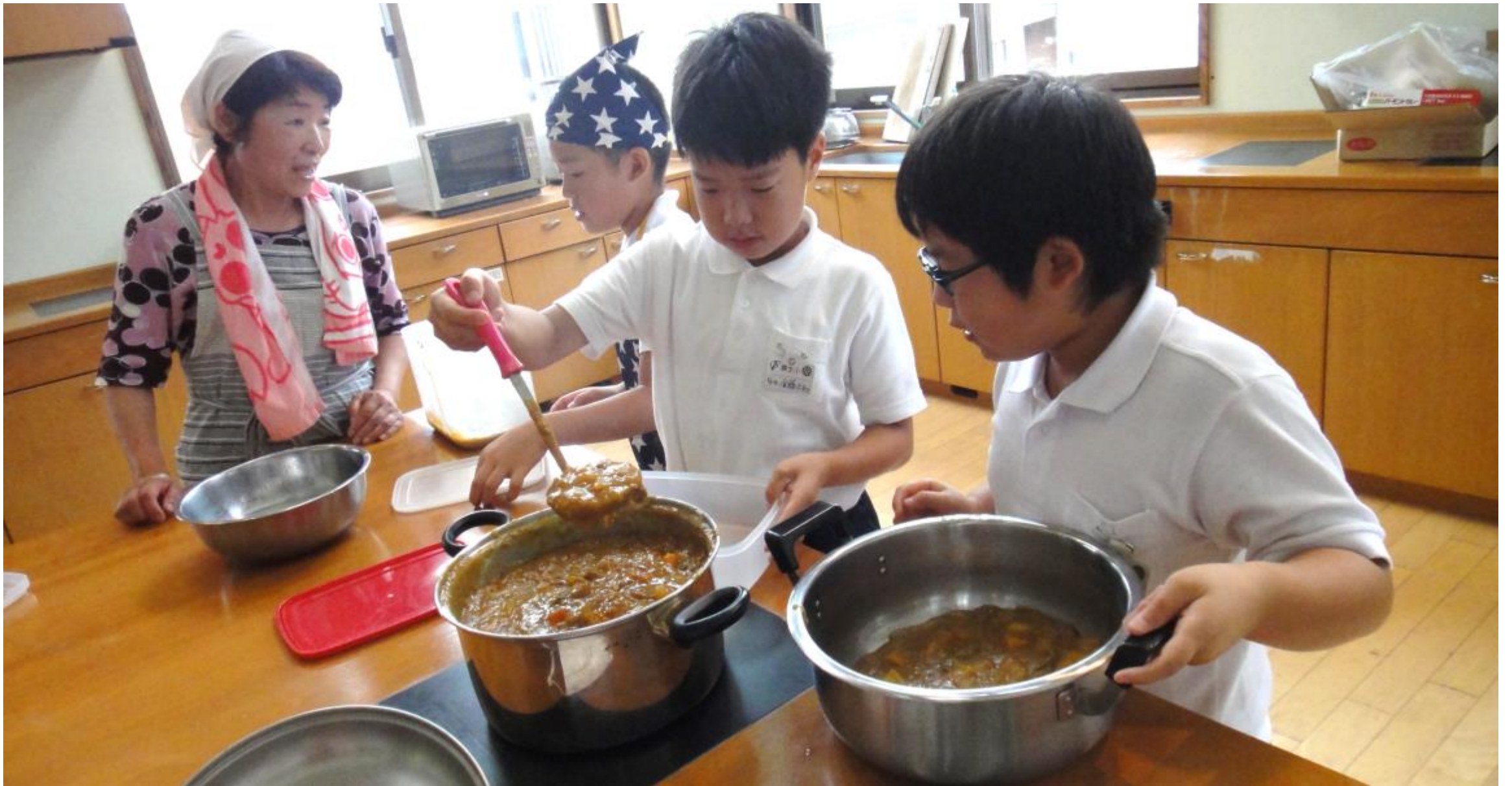
地域ボランティアの方と一緒に「カレーづくり」 (栗生学区)