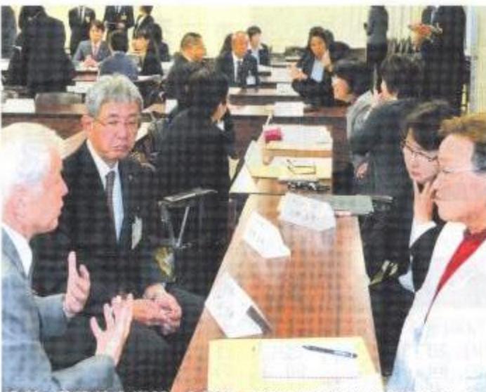
高校、義務教育学校、小学校、保育園の代表が初顔合わせ。

8月に初開催された保幼小中高合同研修会に、高校を加えた県内初の試み。約50人が出席した。研修の目的は、人工知能やロボットの登場で社会が大きく変わる第4次産業革命時代を生き抜き、地域の発展に貢献できる人材を育てるには、0歳〜18歳の間にどのような