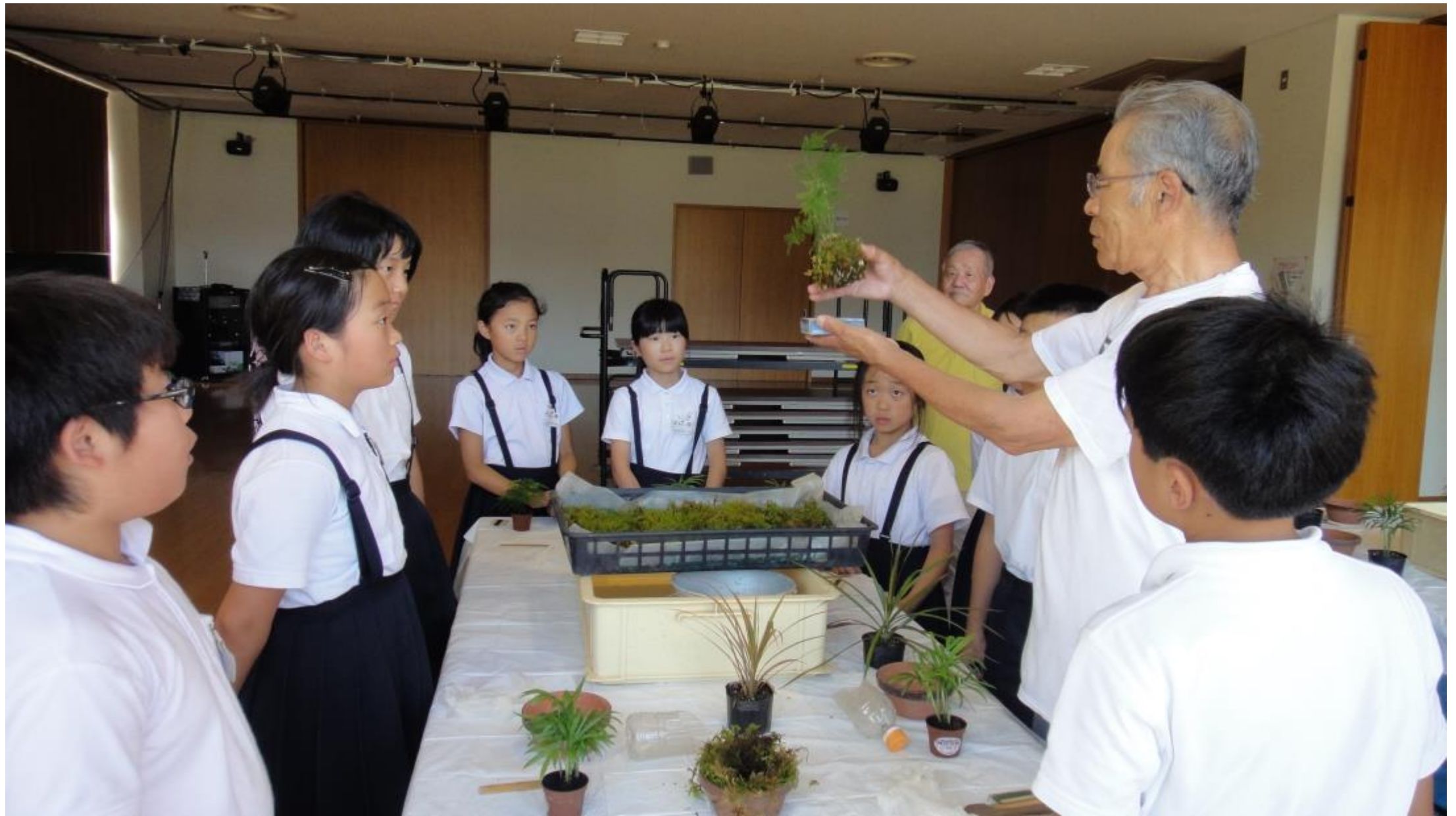
ボランティアによる「こけ玉づくり」の指導（栗生学区）