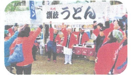
開店直前・気合一斉「ガンバロー!!!」

香川では、テレビ放映などでも著名な「さぬき麺業」さん。香川社長を含む三人のプロが主要作業ポストに、讃友会有志による数名のボランティア作業員が中間受け渡し、料金收受までの各作業工程に参加。声を大にしての呼び込みで盛り上げ。