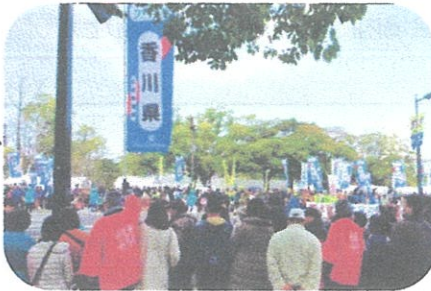
平和公園ゴール間際必死の応援

★翌朝の香川地元紙四国新聞は「序盤に崩れ 苦しい展開」との大きな見出し。荒川監督談、真顔でコメント「本当に残念。悔しい。課題を整理し、来年は、必ずリベンジします」