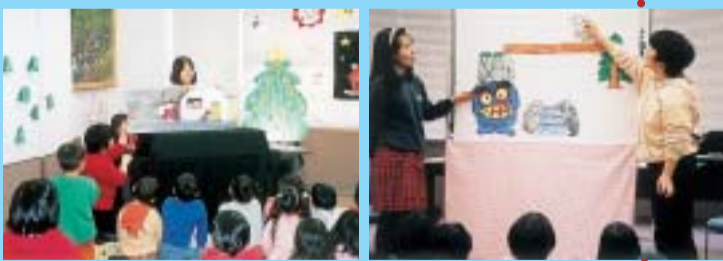
甲奴町おはなし会サークル「へびくんのおさんぽ」

平成13年3月現在、約300の読書ボランティアグループが県内各地で活動しています。幼稚園、保育所、学校、地域と、その活動はどんどん広がっています。