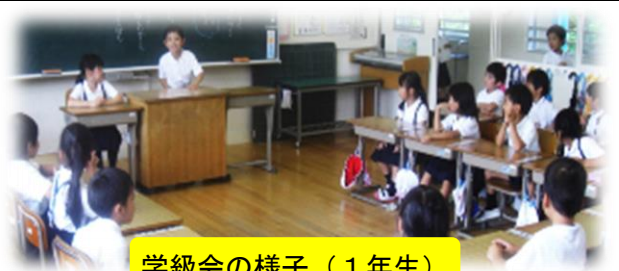
学級会の様子(1年生)

「学校生活をよりよくするのは、自分達だ。」という学校生活づくりへの参画意識を児童に持たせるためには、普段の学校生活の中で、いかに 児童の思いや気づきを引き出し、話し合っ解決するという経験を多く積ませるかが重要である。 本校では、昨年度から少しずつ学級活動(1)の取組の充実を図るとともに、