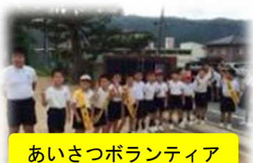
あいさつボランティア