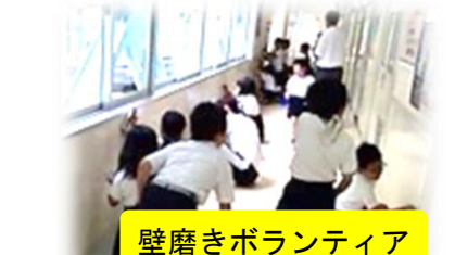
壁磨きボランティア