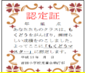
もくどうマスター認定証

そこで、取組開始から1週間後に、給食放送で取組の意図や様子を伝えたり、目標を達成した学級には「〇〇認定証」「〇〇賞」などを渡したりするなど、評価の工夫等を行った。これらのことが児童の意欲につながった。