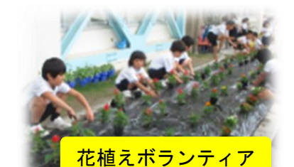
花植えボランティア