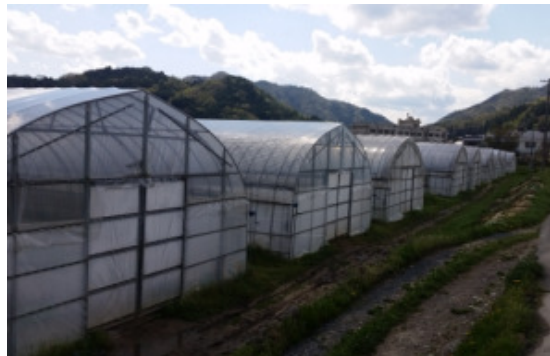
約1haのハウスで栽培しています