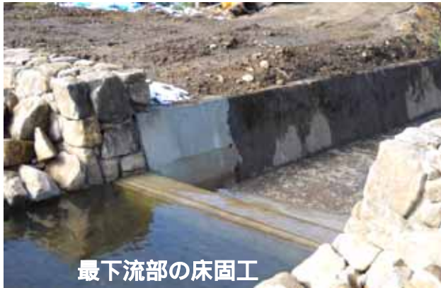
最下流部の床固工

今後とも、皆様の御理解と御協力を得ながら事業を進めていきたいと思しますので、よろしくお願ひします。