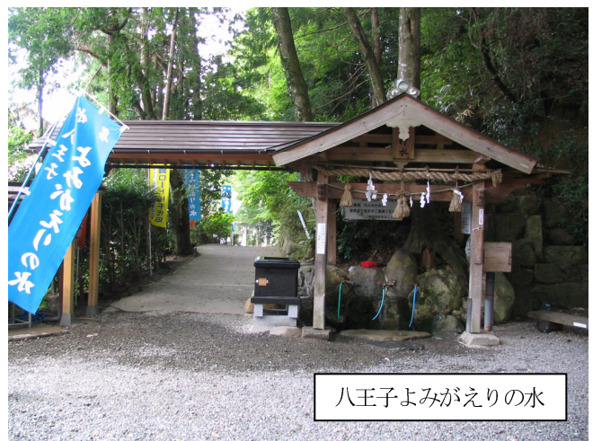
八王子よみがえりの水