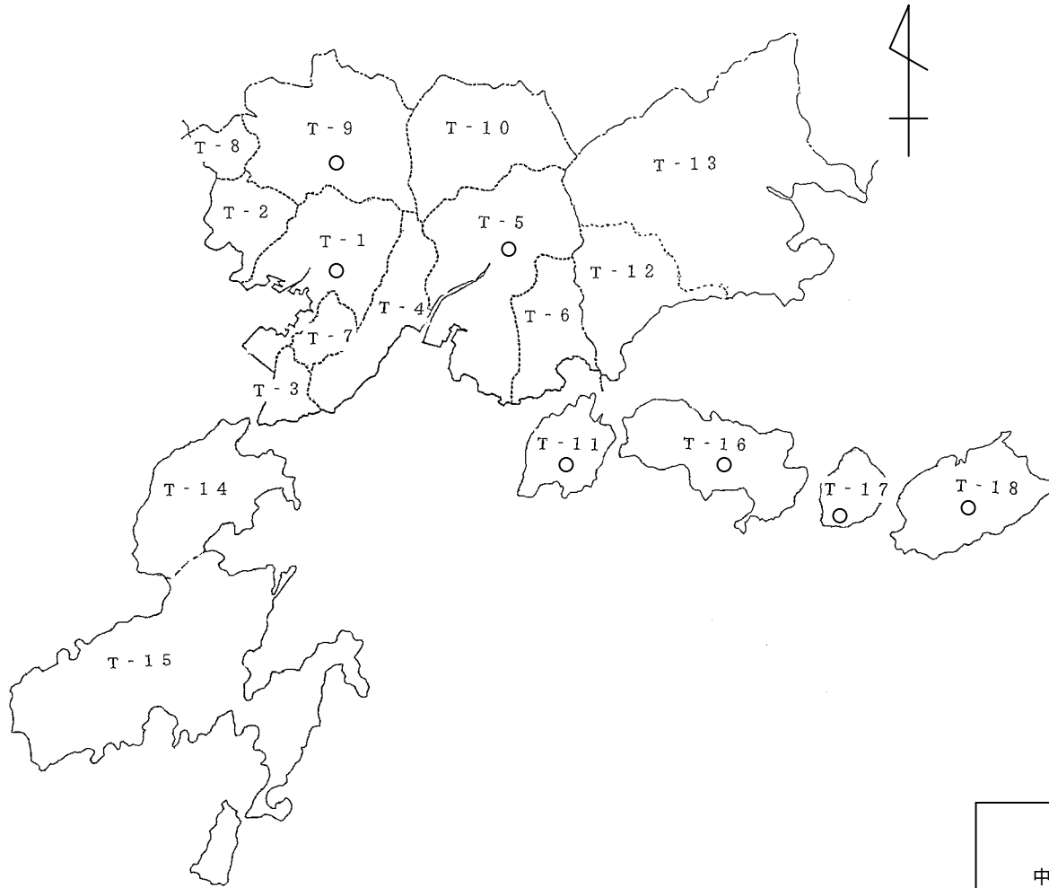
地下水調査測定点配置図(4) (呉市の区域)