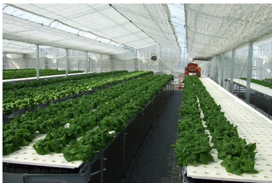
遮光カーテン展開時