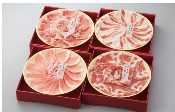
広島もち豚しゃぶしゃぶセット