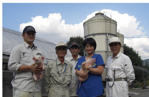
生産者(農事組合法人三共グリーン)