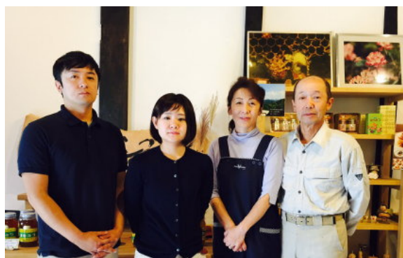
私たち夫婦と息子夫婦の4人で頑張っています