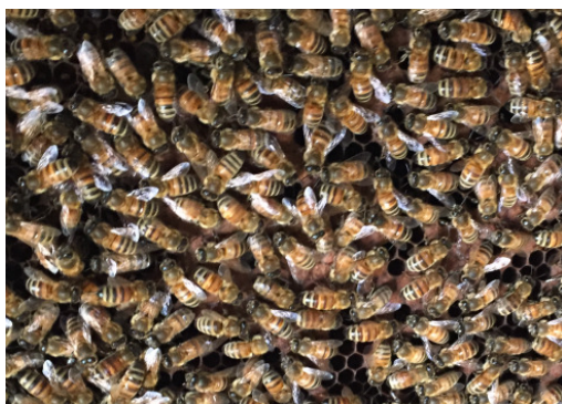
巣箱の元気なミツバチ