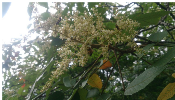
ミツバチが訪花している様子(ヌルデの花/9月)