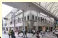
広島アンデルセン

「魅力ある建築物の創造に向けた人材育成」のための広島県が実施する設計コンペティションのプレゼンテーションから最終審査まで全て公開にて実施します。