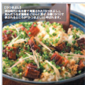
ご提案するメニュー 丼