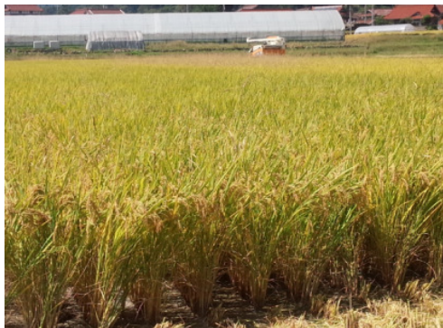
あきさかりの圃場写真