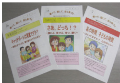
〈 全24プログラム集 〉

⇒ http://www.pref.hiroshima.lg.jp/kyouiku/gakushu/center/index.html